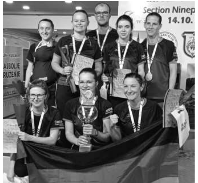
Kegeldamen des SV Pöllwitz bei der Siegerehrung in Apatin