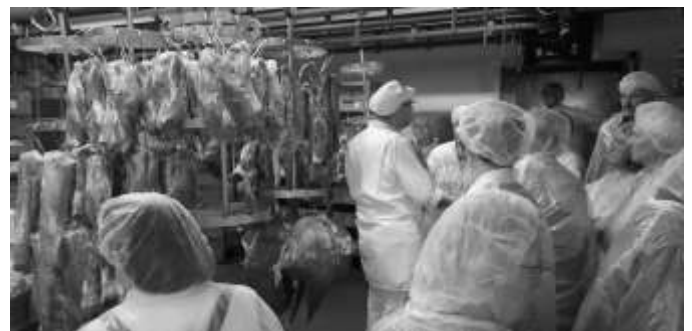
Viel Wissenswertes erfuhren die Frauen in der Metzgerei von Herrn Schön. Text/Foto: Gabriele Wetzel