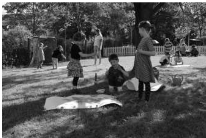
Die Kinder und das Team vom Sonnenschein

Wir danken allen tüchtigen Helfern, die diesen Tag zu einem Besonderen werden ließen.