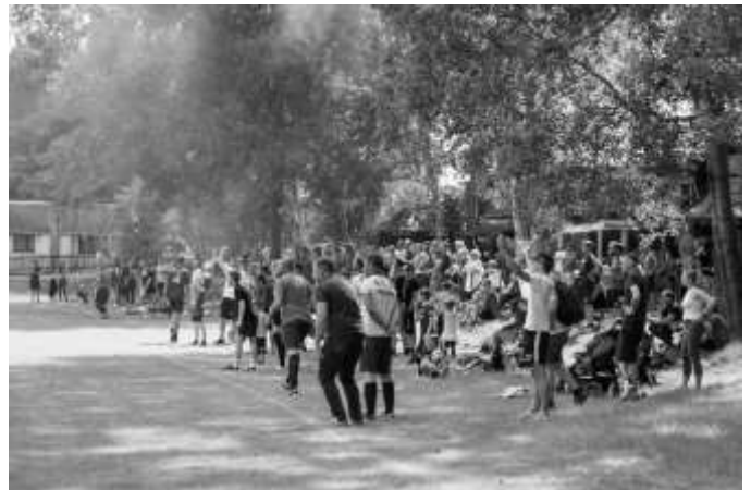
SV Niederböhmersdorf freute sich über zahlreiche Besucher Text/Bild Conny Simon

Beim Spiel Tabellen-Erster gegen Tabellen-Zweiten unterlag jedoch der neue Meister der Freizeitliga, SG Grün-Weiß Tanna II, den Kickern aus Görkwitz mit 0:1. In einem oftmals die Gemüter erheizenden Pokalfinale, schoss Dr. Limmer seine SG Görkwitz zum Pokalsieg.