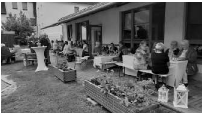
Gelebte Gemeinschaft der Ehrenamtlichen des Pfarrbereiches Pöllwitz-Schönbach im Gelände der Kita Bernsgrün.

Nach dem Gottesdienst bestand für alle ehrenamtlichen Mitarbeiter die Gelegenheit, im Freigelände der evangelischen Kindertagesstätte „Arche Noah“ bei einem von den Erzieherinnen liebevoll bereitgestellten Imbiss miteinander ins Gespräch zu kommen und die Kontakte untereinander zu vertiefen.