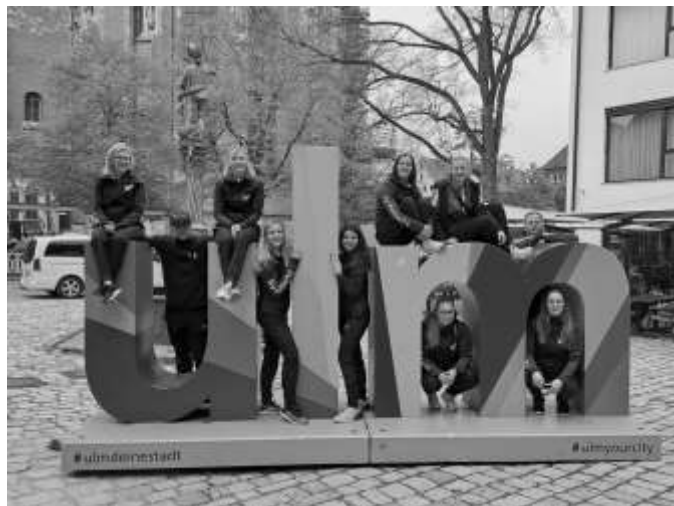
Die Damen des SV Pöllwitz beim Stadtbummel während des Final Fours im Deutschen Pokal in Ulm.