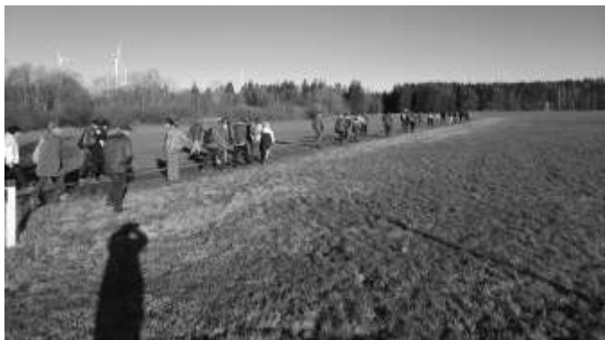
Nach der Rast wanderten alle in Richtung Ebersgrüner Windräder.