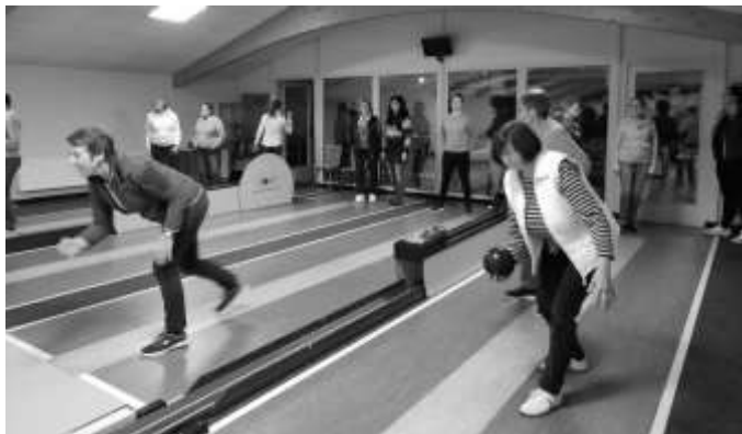
Keine ruhige Kugel schoben die Bernsgrüner Sportfrauen auch 2024 nicht, wie hier aktiv auch beim Kegeln zu sehen ist.

Seniorinnen die diesjährige Weihnachtsfeier vorbereiten und durchführen. Des Weiteren ist eine gemeinsame Ausfahrt geplant, die die Gemeinschaft und den Zusammenhalt der Sportfreundinnen untereinander weiter festigen soll.