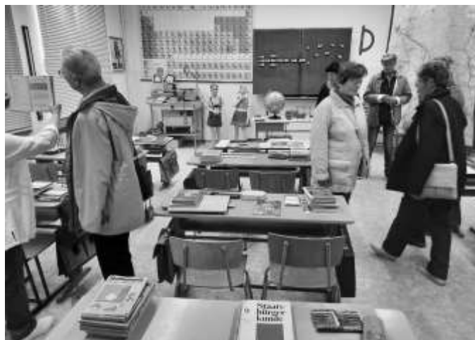
Ein Schulzimmer von anno dazumal in der Heimatstube Langenwolschendorf weckte Erinnerungen an die eigene Schulzeit.