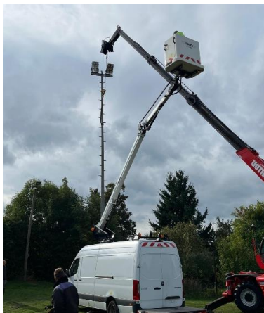
Aufbau des neuen Mastes