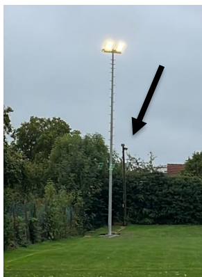
Der Neue 14m, dahinter der alte Mast