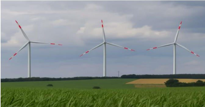
Blick von Hirschbach auf Langenwetzendorf/der kleine Strich ist der Schornstein der Schweinemastanlage! 5 Windkraftanlagen sind dort geplant

Liebe Mitsreiter, liebe Interessierte, sehr geehrte Damen und Herren, am 19.11.2023 fand die 2. Öffentliche Sitzung unserer Bürgerinitiative im Kulturhaus Langenwetzendorf statt. Wir sagen an dieser Stelle Dankeschön allen Teilnehmern. Über 150 Gäste konnten wir begrüßen.