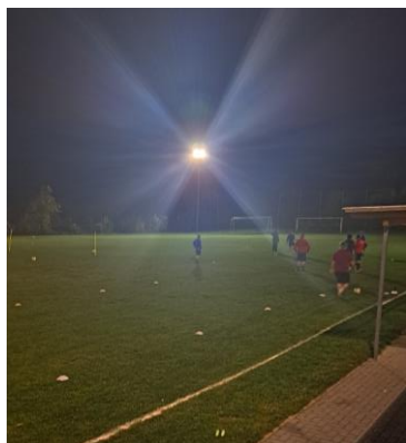
Es werde Licht!

Die D-Junioren der Spielgemeinschaft waren die ersten, die ein Pokalspiel unter „Flutlicht“ absolvieren konnten. Vielen Dank an alle, die das wichtige Projekt unterstützt haben.