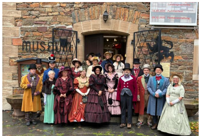
„Historisches Treiben beim Familienfest“

Das Museum Reichenfels ist im Dezember noch bis zum 4. Adventswochenende geöffnet und ein letztes Mal am 29.12. von 14 bis 16.30 Uhr. Im Januar und Februar bleibt das Museum für Sammlungspflege und Umgestaltungen geschlossen. Am 18. Januar und 15. Februar des neuen Jahres finden die Sonntagsgespräche statt und im März eröffnen wir mit der Künstlerin Uta Zaumseil das neue Museumsjahr.