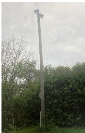
Der alte Mast 6m

Nun konnte es losgehen, der Mast wurde aufgestellt, einbetoniert und an die Stromversorgung angeschlossen werden. Dies übernahm Baubetrieb Klaus Köhler und Elektro-Pönicke mit Unterstützung des Hohenleubener Bauhofes.