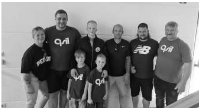
Sogar ein kleiner Fanclub reiste mit nach Oelsnitz.