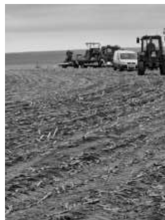
Text/ Bilder: Simona Woköck