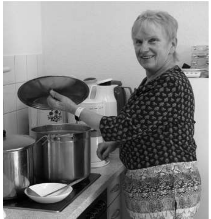
Text/Fotos: Manuela Müller