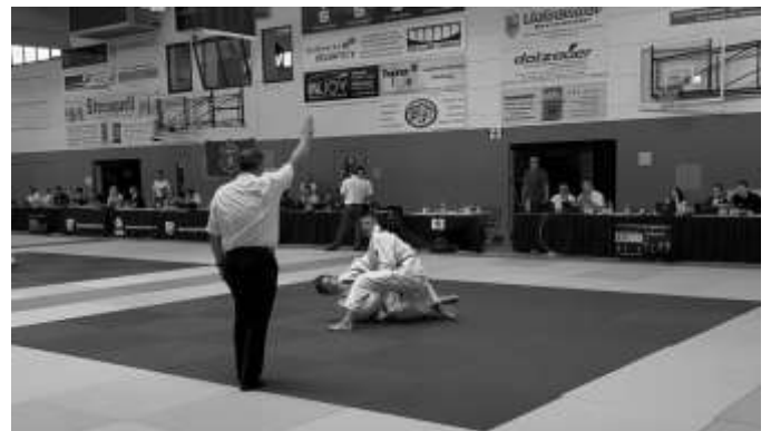
Der Kampfrichter zeigt Ippon an, Sieg im Finale.