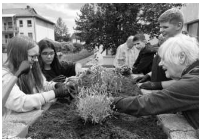
Text/Fotos: Patrick Urban, Ergotherapie & Betreuung PZ Auma