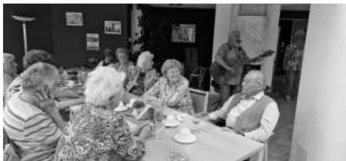
Text/Foto: Manuela Müller