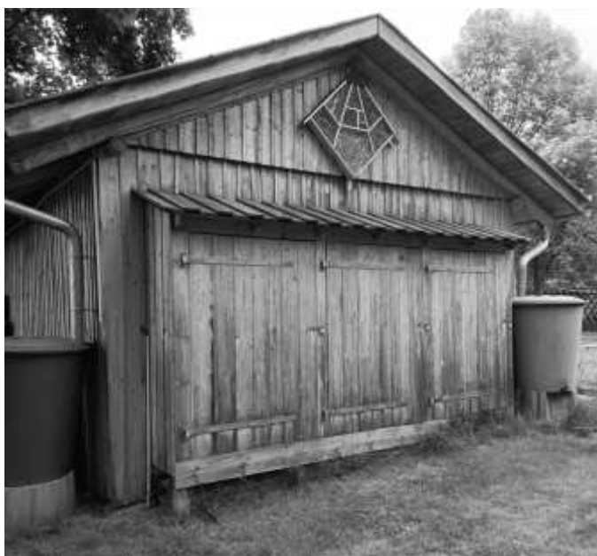
Insektenhotel im Grünen Klassenzimmer der Grundschule Auma

Am Donnerstag, dem 13. Juni, beteiligten sich 10 SuS der 7. Klasse am bundesweiten Schülerfreiwilligentag, bei dem sie mit Bewohnern des AWO-Pflegezentrums Gartenarbeiten zur Verschönerung des Außengeländes durchführten. Die SuS der 10. Klasse wurden am Freitagabend, dem 14. Juni, im Rahmen der Zeugnisausgabe feierlich verabschiedet. Im Juni erhielten wir das Ergebnis unserer Spendenaktion zugunsten des Kinderhospizes Mitteldeutschland. Durch die Aktionen zum Weihnachtsmarkt und zum Tag der offenen Tür sowie der Online-Spenden kam eine Spendensumme von rund 950 € zusammen. Als Anerkennung erhielt unsere Schule die Auszeichnung und Plakette „Schule mit Herz“. Darauf können wir sehr stolz sein. Wir sind zwar eine kleine Schule, können aber auch mit viel Engagement „Großes“ schaffen!