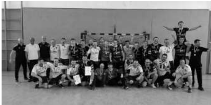
die beiden besten Teams der Regionsoberliga

beide Teams blieb trotz hart umkämpften, kräftezehrenden Spiel nach der Ehrung noch Zeit für ein gemeinsames Foto.