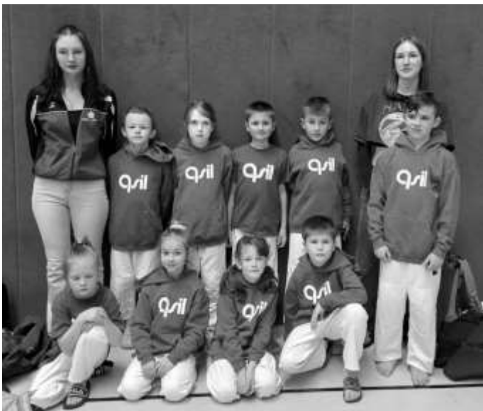
Gruppenbild der Aumaer Judokas bei den Landesmeisterschaften