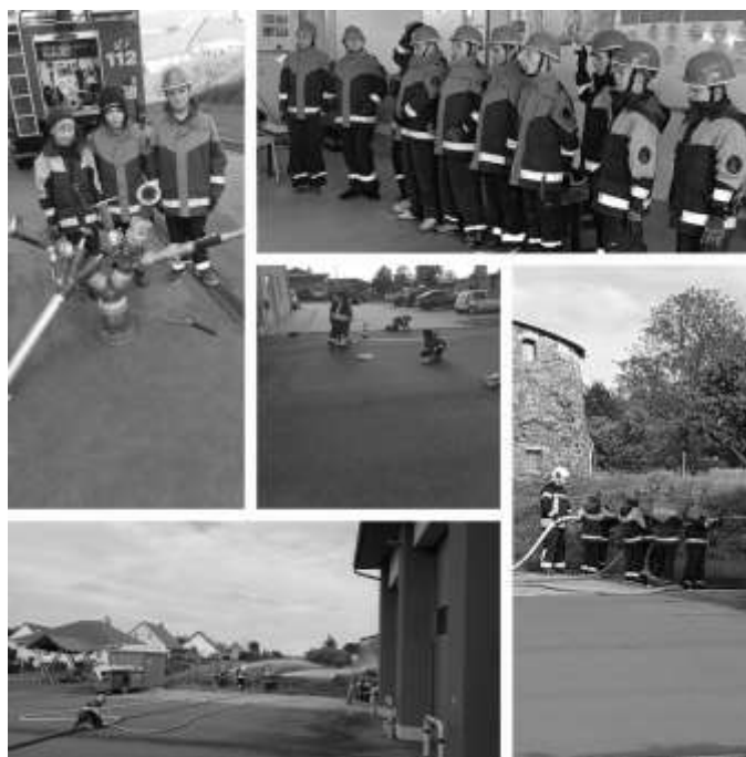
Beauftragte für Öffentlichkeitsarbeit: C. Köhler, FFW Auma-Weidatal

Vom 28.06.2024 bis zum 30.06.2024 findet das diesjährige Kreiszeltlager in Wildetaube statt. Unsere Jugendfeuerwehr nimmt daran teil und bereitet sich darauf vor. In den vergangenen Schulungen sind wir vereinzelt auf verschiedene Themen eingegangen und übten so unter anderem den Löscheinsatz, Schläuche auswerfen, Leinenbeutel befüllen. Wir festigten unser Wissen in Knotenkunde und gingen tragbare Leitern durch. Wir freuen uns euch bald von unserer Teilnahme am Zeltlager zu berichten.