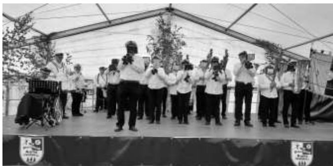
die Oldies des SMZ]