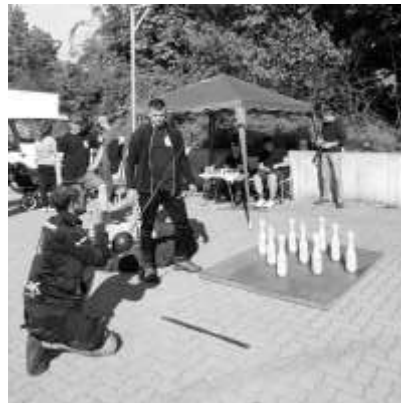
spannend war es beim Bockkegeln

ten passend dazu einige weltbekannte Oldies aus den 60-70er Jahren. Im Anschluss gehörte die Bühne dem „PARTYHEXER“. Dieser begeisterte nicht nur die zahlreichen mitmachenden Kinder vor der Bühne, sondern alle Besucher im Zelt mit einigen Kunststücken und Zaubereinlagen. Draußen wurde es zur gleichen Zeit spannend beim Bockkegeln, schließlich waren die Preise für die ersten drei Plätze schon