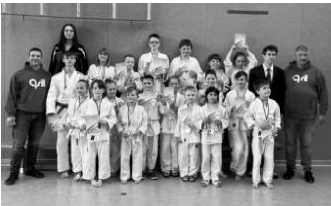
Gruppenbild der Aumaer Judokas bei den Kreisjugendspielen in Greiz Text und Bilder von Sandra Pachali

Durch diese guten Ergebnisse konnten wir den zweiten Platz in der Mannschaftswertung für uns gewinnen.