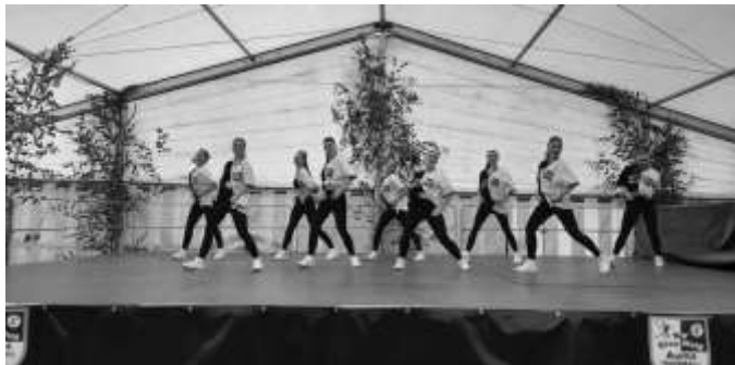
KESS begeisterte die Besucher

Für den kulturellen Auftakt sorgten dann die SMZ Oldies, die mit dem ersten Einsatz einen abwechslungsreichen Nachmittag eröffneten und neben Musik auch einen kleinen und interessanten Einblick in die Geschichte des Vereins gaben. Im mittlerweile vollen Festzelt konnten die Besucher bei Kaffee und Kuchen sowie anderen Köstlichkeiten danach einen glanzvollen Auftritt des Kinder- und Jugendballetts „KESS“ bestaunen.