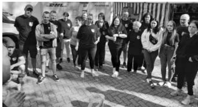
einige Helfer bei der Aufgabenverteilung