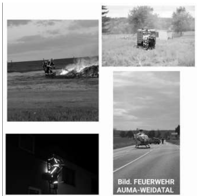
Am Freitag, den 17.05.2024 wurden die Feuerwehr Auma, Wiebelsdorf, Staitz, KBM Zeulenroda und der SBM Auma

alarmiert. Gemeldet war - Vollbrand Scheune mit vermisster Person-. Bei der Anfahrt war der Rauch schon zu sehen. Sofort wurde eine Langwegestrecke für die Wasserversorgung aufgebaut und die ersten Trupps haben sich mit Atemschutz ausgerüstet. In der Scheune wurde unter Brettern die vermisste Person bewusstlos vorgefunden und zügig gerettet. Zum Glück war dies nur eine Einsatzübung und die Aufgaben und Ziele wurden erreicht. Begleitet wurde das ganze an diesen Tag durch ein Team vom MDR und der OTZ, sowie Berichterstatern die auf den sozialen Medien vertreten sind. Ein kurzer Bericht darüber wurde im MDR am darauffolgenden Tag ausgestrahlt und auch in der OTZ konnte man darüber lesen.