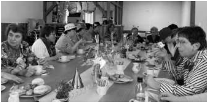
Karnevalsveranstaltung mit Kaffeeklatsch