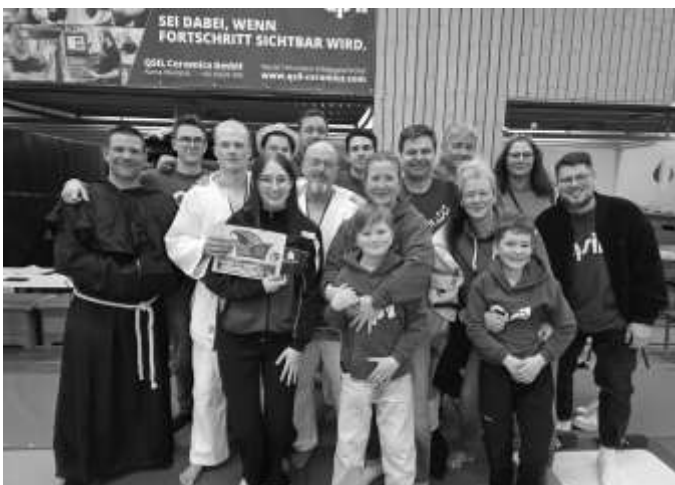
Gruppenbild der am Wettkampf beteiligten Aumaer Judoka

Insgesamt war das Faschingsturnier 2026 in Auma eine gelungene Veranstaltung im Erwachsenenbereich mit vielen spannenden Kämpfen und einer tollen Atmosphäre