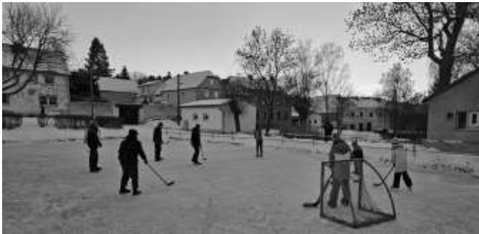
Winterspaß auf dem Dorfteich