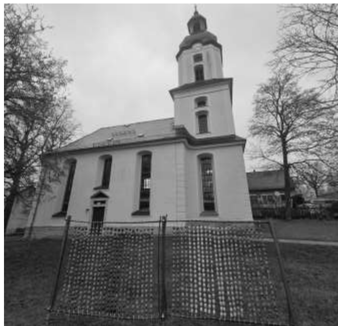
Ostereierregenbogen an der Dorfkirche; Foto: A. Schöler