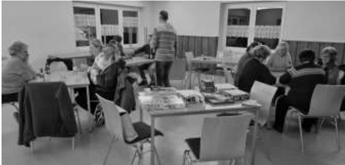
erster Gesellschaftsspieleabend im Januar 2026 im Dorfgemeinschaftshaus; Foto: A. Schöler)