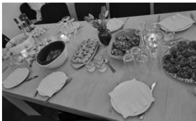
selbstgemachte Leckerein zum Frauentagsstammtisch; Foto: A. Schöler